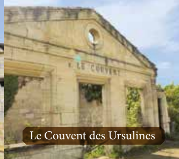
Le Couvent des Ursulines