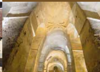
L'église monolithe et son clocher