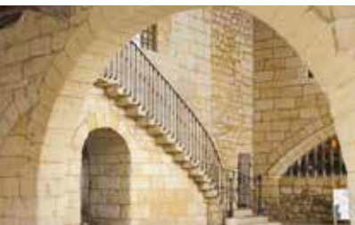
Les halles du marché

Témoignage de nombreux remaniements : le style roman et gothique cohabitent à la fois dans l'église mais aussi dans son cloître.