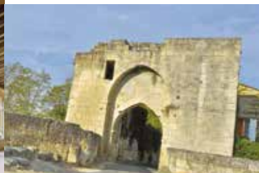
La Porte Brunet et les remparts