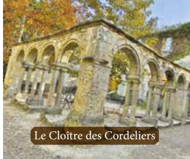
Le Cloître des Cordeliers