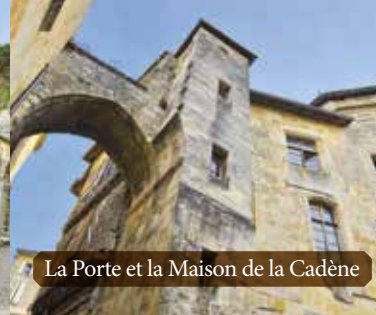
La Porte et la Maison de la Cadène