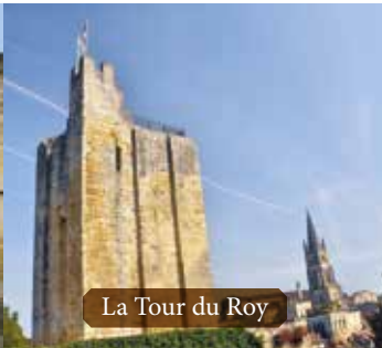
La Tour du Roy

Il ne reste plus de ce magnifique palais du XII e siècle que la partie intégrée dans le mur d'enceinte et située dans le prolongement de l'ancien accès principal de la cité qu'était la « Porte Bourgeoise ».