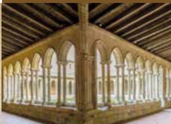
L'église collégiale et son cloître