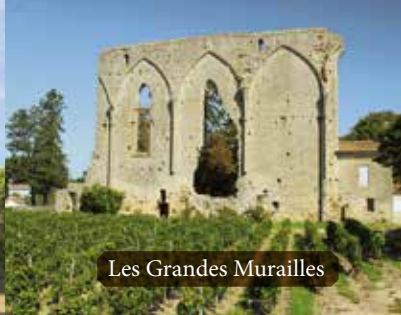
Les Grandes Murailles