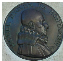
Michel de Montaigne