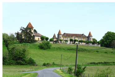
Le village de Montpeyroux